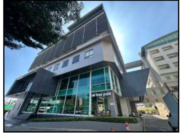
รูปที่ 1.16-1 สภาพโครงการปัจจุบัน