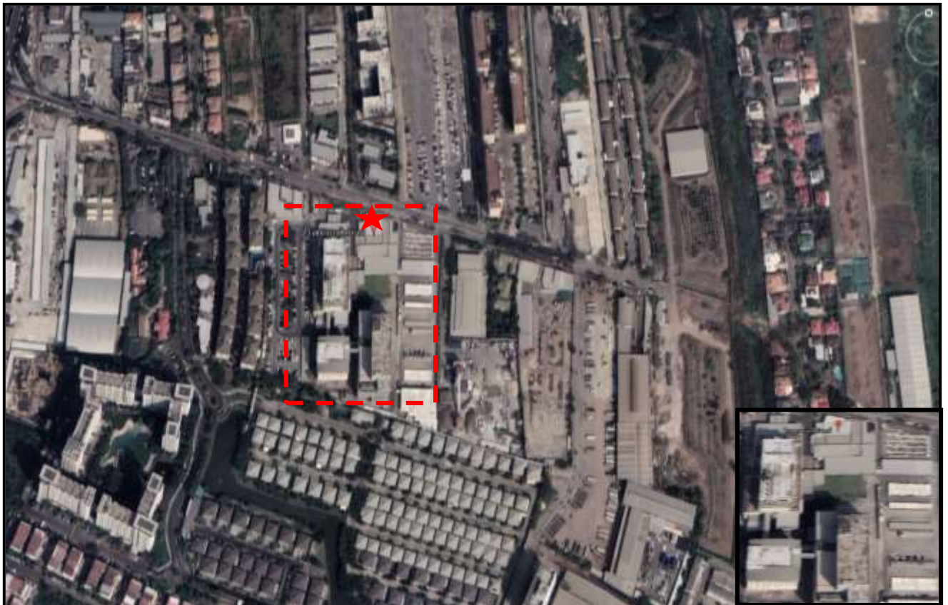
รูปที่ 1.8.1-1 แสดงแผนที่ตั้งโครงการ

โครงการโรงพยาบาลศิริรินทร์ 976 ถนนลาซาล แขวงบางนาใต้ เขตบางนา กรุงเทพมหานคร ดำเนินการโดยบริษัท ศิริรินทร์ จำกัด (มหาชน) แสดงดังรูปที่ 1.8.1-1